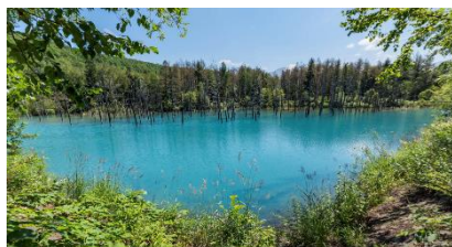
「北海道 美瑛青い池」